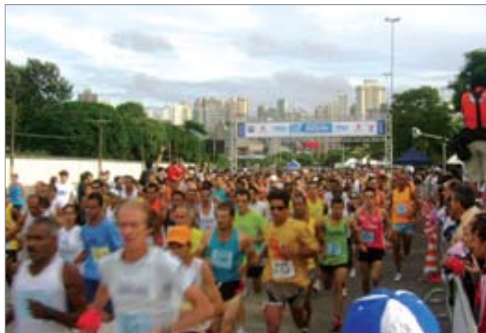
Largada da corrida Oral B 7Km, disputada pela equipe da Solo Brasil Seguros, a prova contou com mais de 20 mil atletas inscritos.